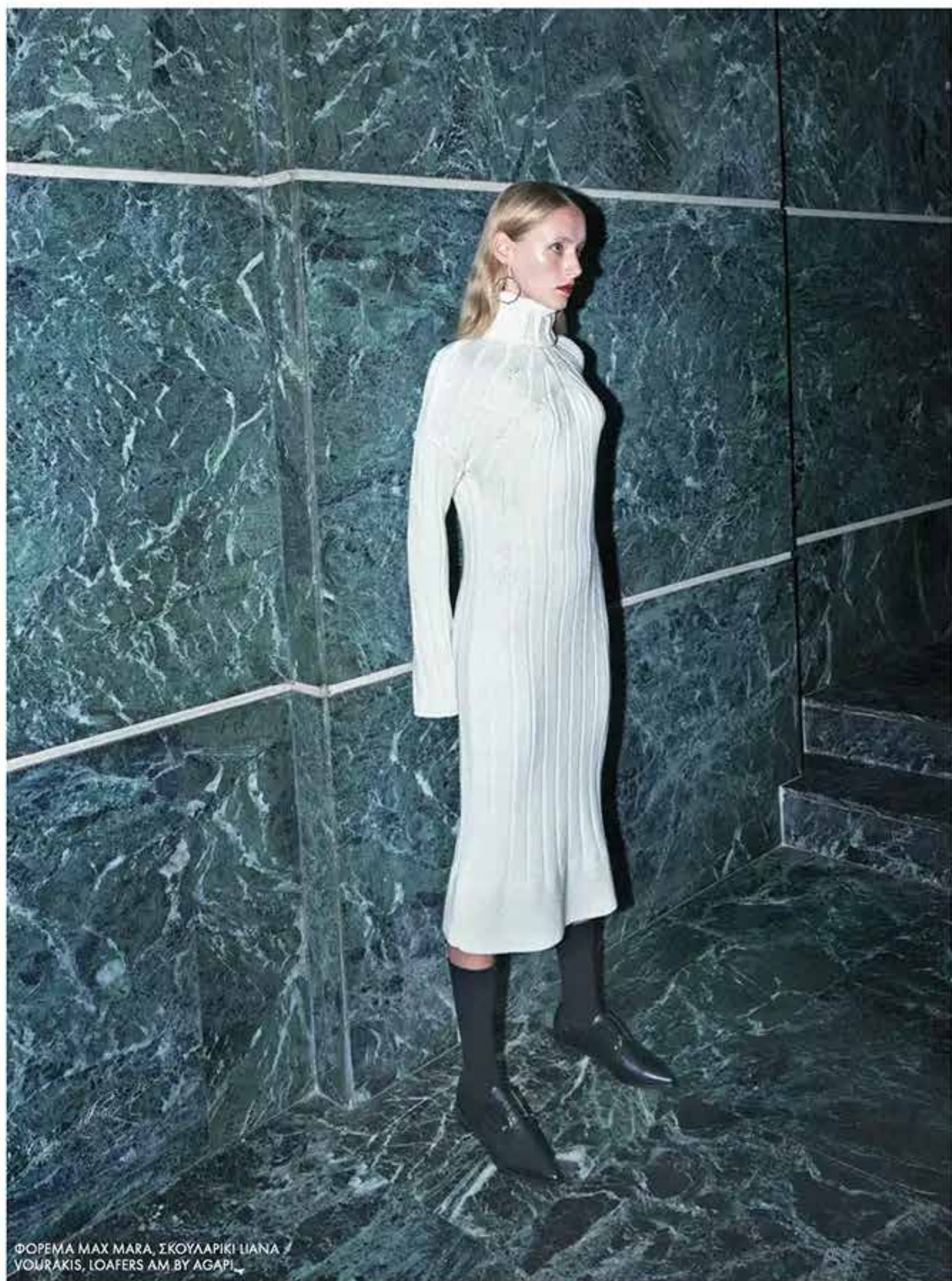
ΦΟΡΕΜΑ MAX MARA, ΣΚΟΥΛΑΡΙΚΙ LIANA / YOURAKIS, LOAFERS AM BY AGAPI.